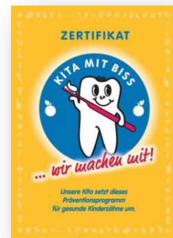
Das aktualisierte Zertifikat-Poster